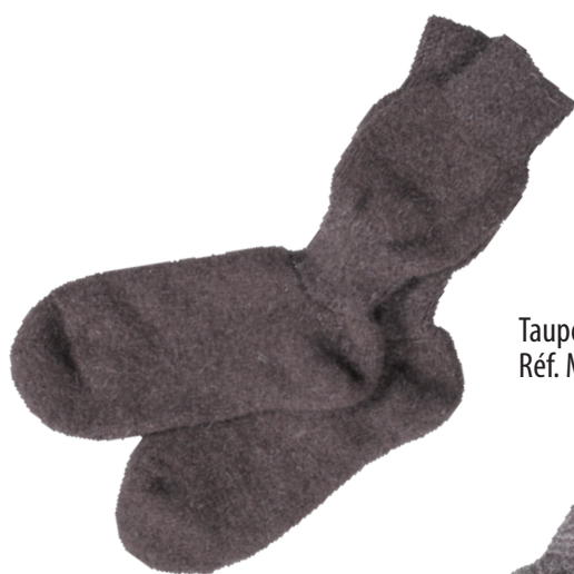
Taupe Réf. MCHI