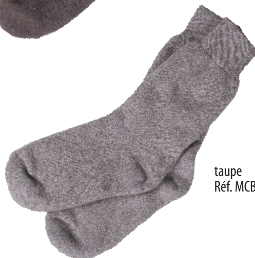
taupe Réf. MCB98Y