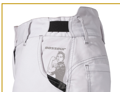
impression poche gauche